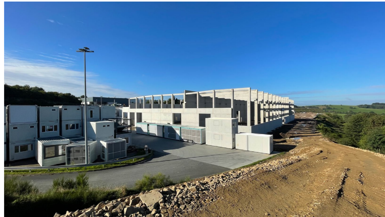
Baufortschritt in Lichtenberg

Ein großer Schritt, um unsere Produktqualität noch weiter zu verbessern, unsere Fertigungskapazitäten auszubauen und noch dazu die Umwelt zu schonen, ist der Bau unserer neuen Produktionshalle in Morsbach-Lichtenberg.